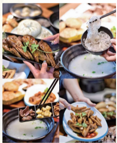
图为代表性秦淮小吃

小吃是我国广大民众十分喜爱的饮食之一，区别于传统正餐，不是为了填饱肚子，而是聊以解馋的一类食物。秦淮传统风味小吃是南京百姓在长期生活实践中，对逐渐发展起来具有一定风格品味和浓郁地方特色的小吃的统称，乃本土饮食体系之一。其加工制作技艺内容丰富，手段独特，独树一帜，是金陵文化的宝贵财富，在我国小吃美食界具有较大影响力。2011年，秦淮（夫子庙）传统风味小吃制作技艺被列入江苏省级非物质文化遗产目录，进一步引发世人关注。 秦淮风味小吃最早出现的时间已无法详考。相传自东吴金陵便有用炒米当点心的现象。明代南京为明朝京师、留都，“十里秦淮”流域进入繁盛期。以夫子庙为核心的淮水两岸，商铺茶寮林立，酒肆歌楼栉比，遂成闻名遐迩的钟鸣鼎食之地，包括小吃在内的美食业发展迅猛。清末民国时期，秦淮风味小吃以各色包子、烧饼和干丝为三大宗，店铺生意兴隆，食客闻香而至。改革开放之后，国民经济飞速发展，1986年，秦淮风味小吃研究会在秉持传统的基础上，推出“秦淮八绝”风味小吃，受到中外食客的交口称赞。千百年来，秦淮风味小吃经久不衰，现已跻身于当代中国“四大小吃”之列。