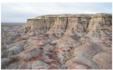
蒙古国鄂尔济特县岩石地貌